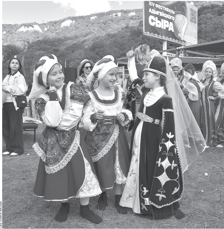
Юные участницы фестиваля