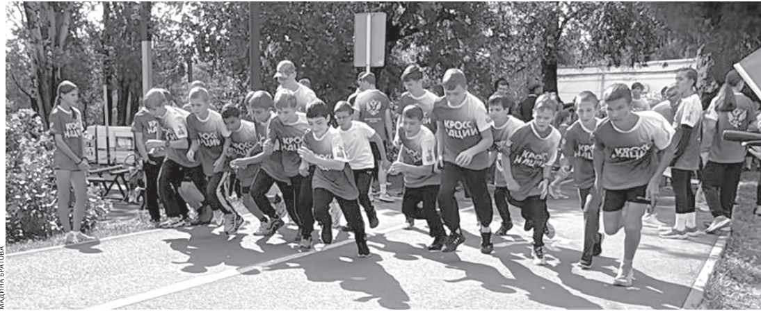
На старт вышли сотни участников — и малыши, и ветераны спорта